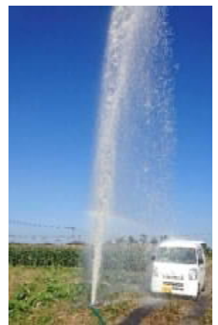
給水栓破損による漏水

このような事故を防ぐ為にも、給水栓の位置が分かるように目印となるような棒を立てておく等の工夫をしていただくようご協力をお願いします。