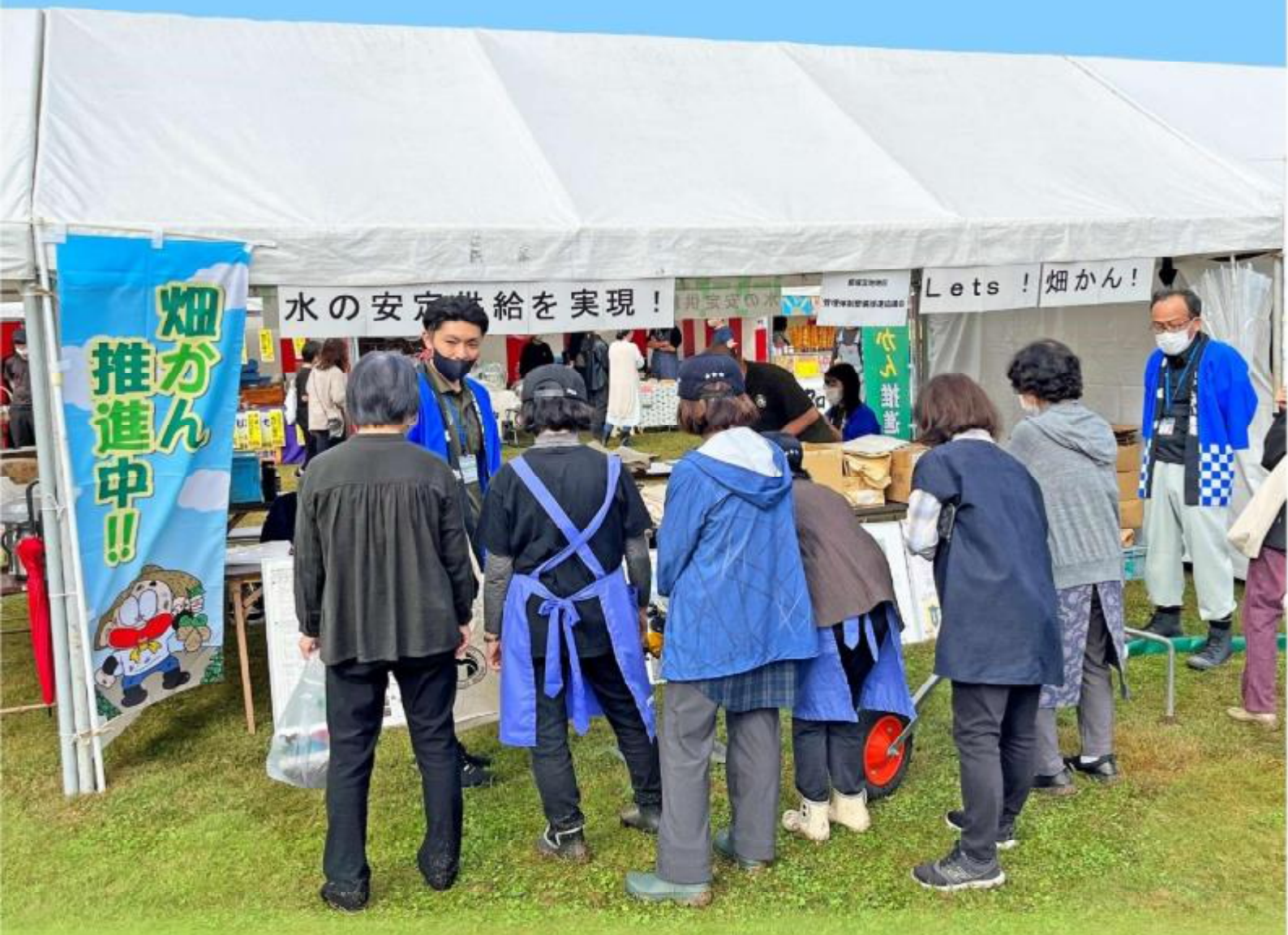
令和4年三股町ふるさとまつりにて畑かん推進の様子