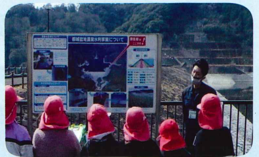
／ 見学の様子 ｝