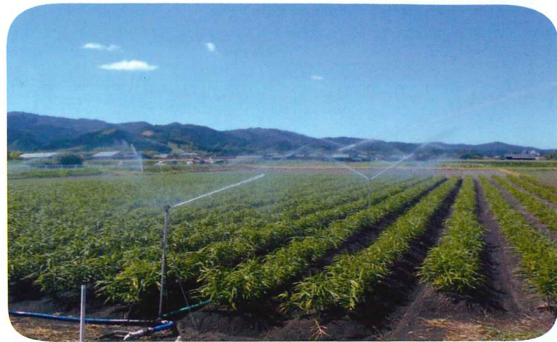
「しょうが」に散水している様子 〈 使用器具 : 立上式スプリンクラー 〉